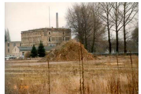
Fläche vor der Sanierung