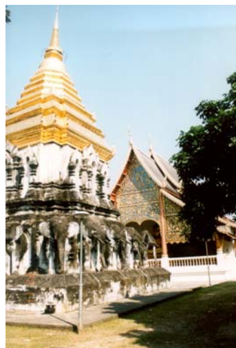
Ältester Tempel in Chiang Mai