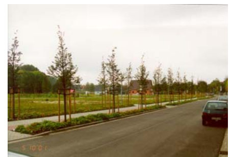
Blick über die sanierte Teilfläche mit Wohnbebauung (im Hintergrund)