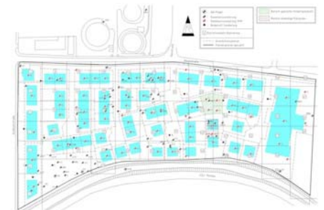
Lageplan mit Darstellung beweisichernder Baufelderkundung