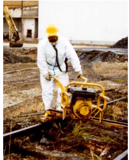
Die Sanierungsmaßnahme erfolgte unter erhöhten Arbeitsschutzanforderungen. Neben persönlicher Schutzausrüstung waren gebläseunterstützte Vollmasken mit Filter zu tragen.

BBodSchG verbindlich erklärten Sanierungsplan realisiert. Dabei wurden rund 15.000 m 3 belastete Massen bewegt und auf dem Grundstück etwa 12.000 m 2 komplett versiegelte Flächen bzw. Oberflächen mit stark reduzierter Versickerung (Parkplätze, Bodenplatten der Gebäude, Rasenflächen mit bindigem Untergrund) geschaffen. Damit wurde die be-