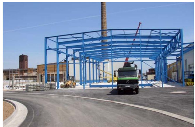
Nach erfolgreichem Abschluss der Sanierungsmaßnahme: Montage des Stahlbaus für die neue Halle von CORUS