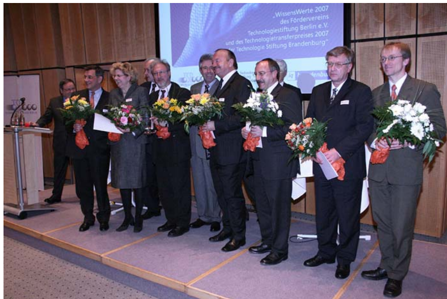
Preisträger der Berliner und Brandenburger Transferpreise