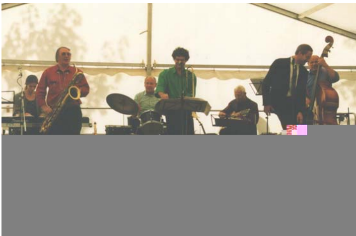
Für den musikalischen Auftakt sorgten die "Elb Meadow Ramblers"

Die "Ermittlung der Explosionsgefährdung auf Binnenschiffen" stand im Mittelpunkt des Vortrages von Dr. Hempel. Anhand von ausgewählten Vorkommnissen der letzten Jahre verdeutlichte Dr. Hempel die