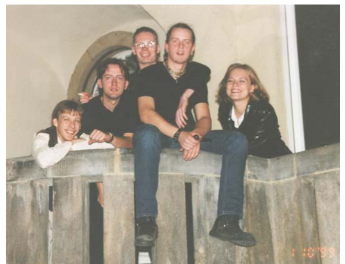
Zum Ausklang des Abend spielte die junge Dresdner Band "Degagement"

Zu vorgerückter Stunde herrschte bei vielen Gästen Einigkeit darüber: Der 1. Oktober 2004 sollte im Kalender vorgemerkt werden. Die GICON-Mitarbeiter werden in den nächsten fünf Jahren ihr Bestes geben und bis dahin weiterhin allen fachlichen Erwartungen entsprechen, um dann ein erfolgreiches Zehnjähriges zu feiern.