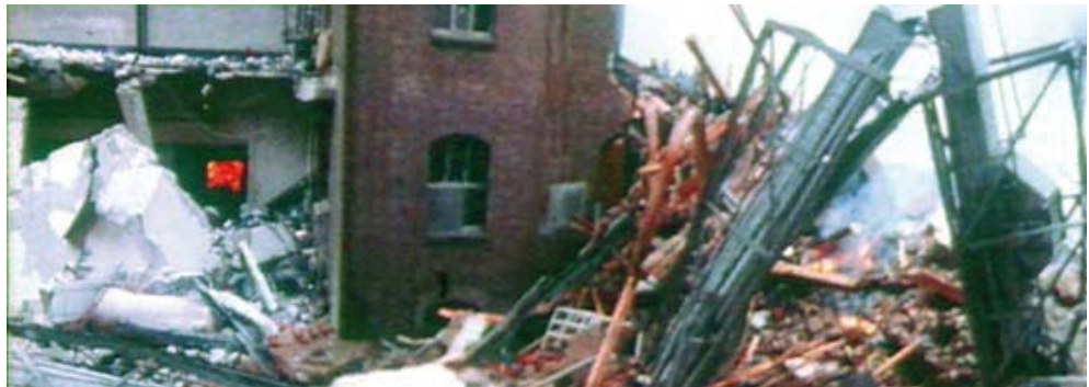
Ein Funke genügt: Mehlstaubexplosion

Aber es reicht nicht aus , wenn z. B. im Rahmen von Genehmigungsverfahren (vor Inkrafttreten der BetrSichV) Unterlagen zum Explosionsschutz erstellt wurden, diese an Stelle der Explosionsschutzdokumente zu verwenden.