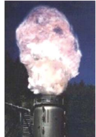
Staubexplosion in einem 60 m 3 -Behälter auf dem Versuchsfeld der BGN/FSA

Betriebsmittelbezogene Dokumente (z. B. Baumusterprüfbescheinigungen) können auch in den allgemeinen Betriebsunterlagen verbleiben.