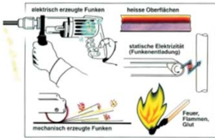
Beispiele für das Entstehen von Funken

Vorteil: durch die neuen Regelungen in den Beispielsammlungen besteht auch die Möglichkeit der Zonenreduzierung – soweit vertretbar (wichtig für Bereiche, in denen mechanische Betriebsmittel zum Einsatz kommen, da der Nachweis für den Einsatz nicht immer einfach ist)