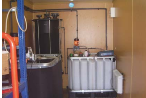
▲ Blick in den Versuchscontainer mit Methanreaktor während der Montage

Methanreaktor mit Inoculum aus der Technikumsanlage Cottbus und anschließendem Anfahren der Gesamtanlage durch unseren Anlagentechniker Sebastian Lattke vor Ort in Cottbus wurde die Biogasanlage durch den Auftraggeber EBZ GmbH abgenommen