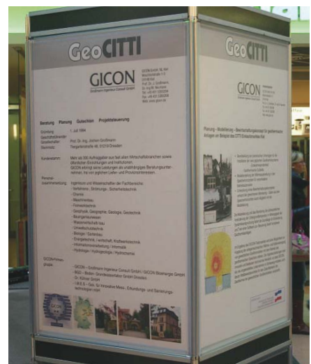
▲ GICON-Poster zur Projekt-Auftaktveranstaltung in der Citti-Mall

Ziel des Forschungsteiles ist es, gemeinsam mit den o.g. Partnern Optimierungsmöglichkeiten für die Nutzung derartiger Anlagen zu entwickeln und zu verallgemeinern, insbesondere sollen folgende Ergebnisse erzielt werden: