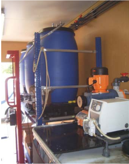
▼ Hydrolysereaktoren mit Pumpendosiertchnik

Im Sommer 2008 wurde eine Kleintechnikums-Versuchsanlage nach dem GICON-Verfahren konzipiert und innerhalb von 30 Tagen in einem Versuchscontainer errichtet. Auftraggeber war die Entwicklungs- und Vertriebsgesellschaft Brennstoffzelle mbH aus Dresden. Nach der erfolgreichen Beimpfung des Füllkörpermateri- als für den