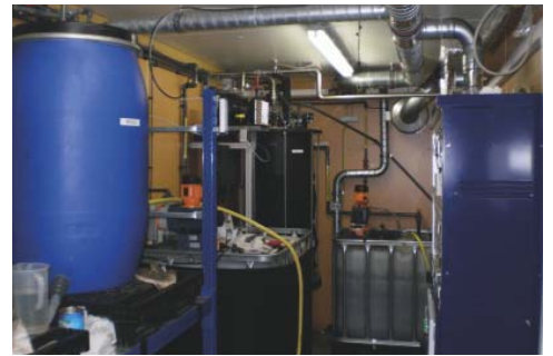
▼ Blick in die Technikumsanlage mit Biogasanlage und reforming unit

Die GICON GmbH betreibt eine Großtechnikumsanlage nach dem gleichen Verfahren in Cottbus und hat eine industrielle Pilotanlage in Schöllnitz errichtet, in der die Inbetriebnahme abgeschlossen ist. In diesem Jahr ist die Errichtung einer weiteren Biogasanlage geplant.