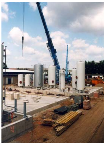
Aufstellen der Produkttanks im Sommer 2002

Im Stadtteil Dresden-Reick entstand auf dem seit langer Zeit genutzten Betriebsgelände eine moderne Anlage, die es Elaskon ermöglicht, auf Kundenwünsche zu reagieren und mit dem umfangreichen Produktionsortiment seine Marktstellung zu sichern.