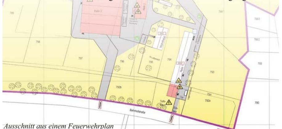
Ausschnitt aus einem Feuerwehrplan

chemischen Industrie analysiert und bewertet. Mit der abschließenden Beurteilung durch einen bekanntgegebenen Sachverständigen für bautechnischen Brandschutz können somit bereits im Vorfeld einer Baumaßnahme spezifische brandverhütende bzw. -begrenzende Maßnahmen sinnvoll festgelegt werden.