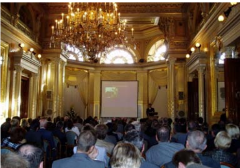
Links: Vortragsprogramm im Kronensaal