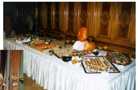
Gastronomische Betreuung durch Schülerinnen und Schüler der HOGA