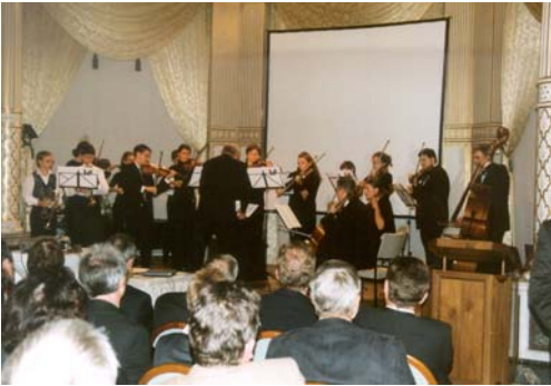
Links: Schüler der Musikschule Sächsische Schweiz