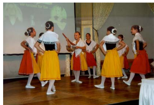
Kindertanzgruppe des Tanzhauses Dresden-Friedrichstadt

Abschließend bedanken wir uns noch einmal herzlich für die zahlreichen Glückwünsche, Blumen und originellen Präsente, die uns für die nächsten ...zig Jahre anspornen.