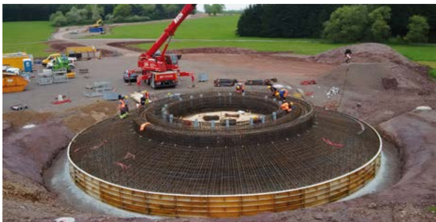
▲ Fundament-Betonage einer Neuanlage

Die Software CoCheck ist seit mehr als 20 Jahren Teil der GICON-Erfolgsgeschichte. Seit November 2016 zählen auch die EUROVIA Industrie GmbH und die EUROVIA Gestein GmbH aus der Steine+Erden-Branche zum Kundenkreis. CoCheck bietet für beliebige Anlagentypen eine umfassende Unterstützung bei der operativen Betriebsführung inkl. Genehmigungs- und Energiemanagement, Gefährdungsbeurteilungen u.v.a.m. www.cocheck.de