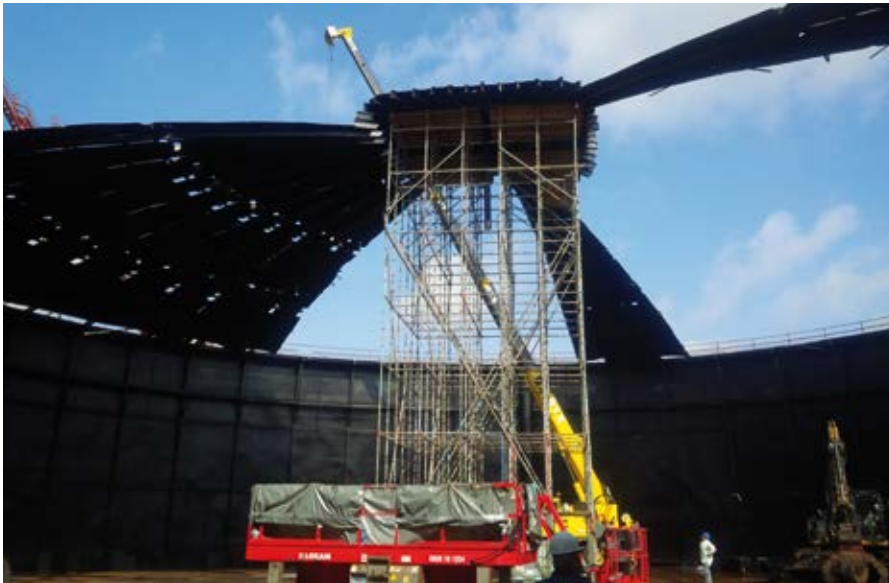
▲ Rückbau des Glockendaches

Dank starker Vernetzung der Ingenieurdienstleistungen gelingt der schnelle Rückbau eines fast 50 Jahre alten Gasometers im vereinbarten Zeit- und Kostenrahmen