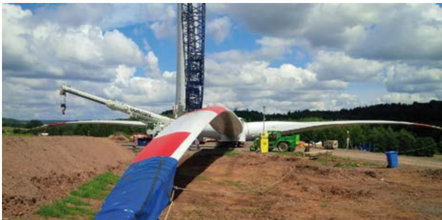
▲ Vorbereitung Sternmontage der Rotorblätter im Sommer 2016