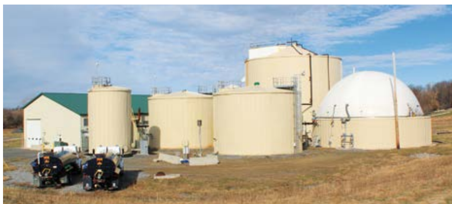
▲ „Cayuga Regional Digester“ in Cayuga County