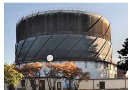
▲ Gasometer vor Beginn des Rückbaus